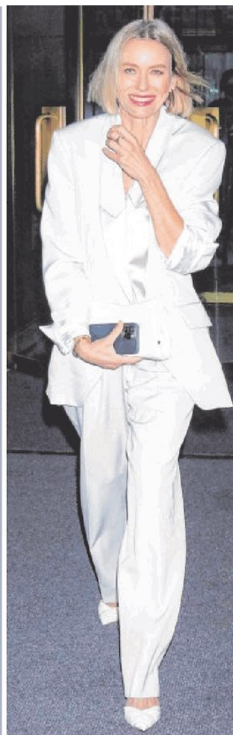
Weißer Blazer, 69,95 Euro, Anzughose, 39,95 Euro, beides von Zara, www.zara.com