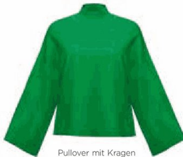
Pullover mit Kragen von Philo-Sofie Cashmere , um 239 Euro