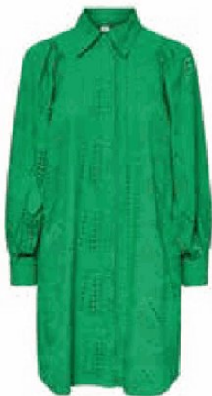
Verspieltes Minikleid von YAS über Kastner & Öhler , um 79,99 Euro