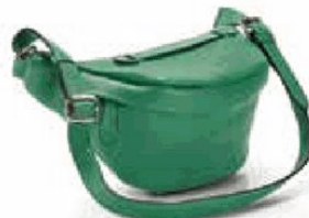
Bauchtasche in Matcha Green von Madeleine , um 169,95 Euro