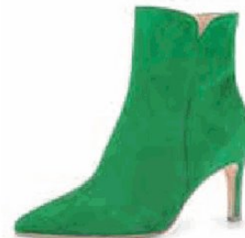
Gabor Stiefelette über Otto Versand , um 135,99 Euro