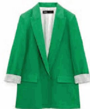
Power Dressing: Cooler Blazer von Zara , um 49,95 Euro

Schwarz war gestern. Frauen mit Stil tragen in dieser Saison Grün. Wem das allover zu bunt wird, der greift zum Highlight Piece in der Trendfarbe.