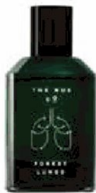
Waldatmung für die Haut: The Nue Co. Duft über Niche Beauty , um 95,- Euro